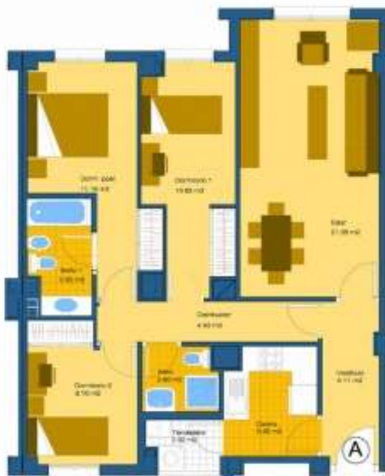
Vivienda de 3 dormitorios