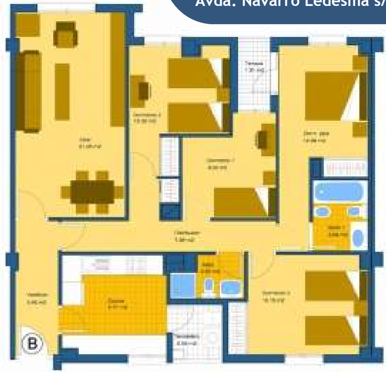
Vivienda de 4 dormitorios