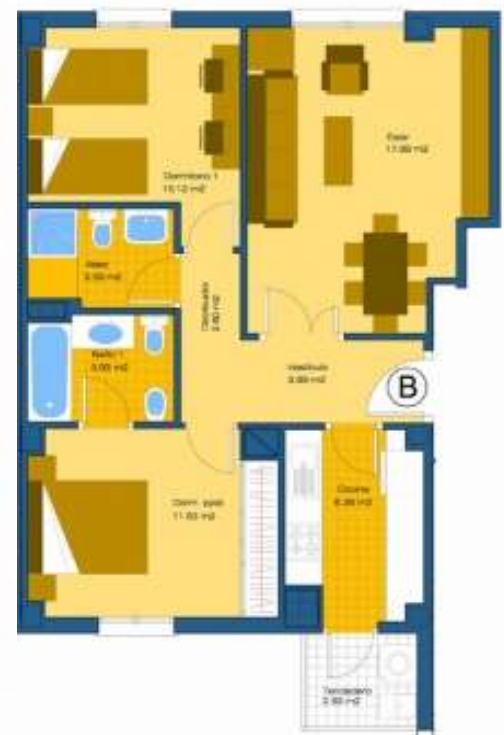
Vivienda de 2 dormitorios